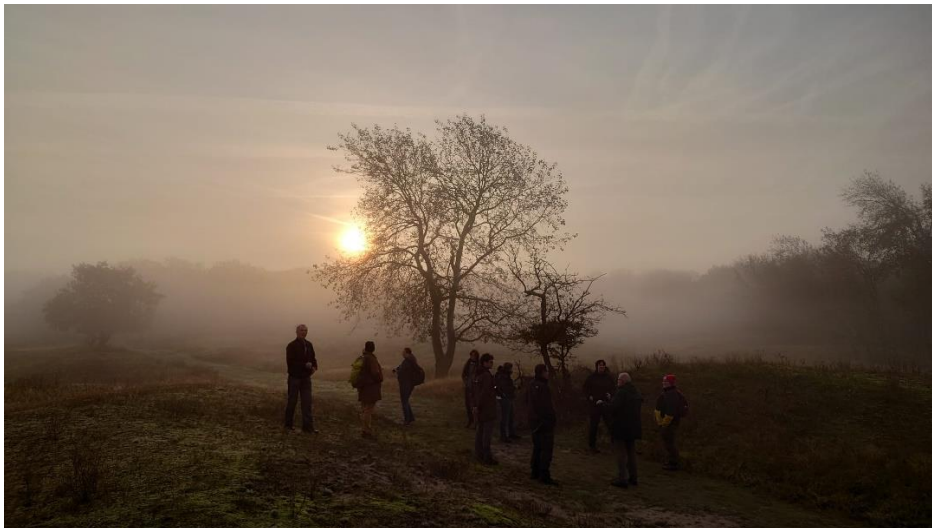
Een mistige herfstochtend

De oktoberwandeling was een echte herfstwandeling die begon in de mist. Vanaf de Varenlaan konden we de Berg van Mikwel niet eens zien liggen. Alles was nat van de mist en de dauw, ook onze schoenen raakten doorweekt. Toch heerlijk gewandeld, met het burlen van Damherten op de achtergrond. Op twee plaatsen stond zo'n grote, imposante hertenbok ons toe te roepen vanaf een heuveltje.