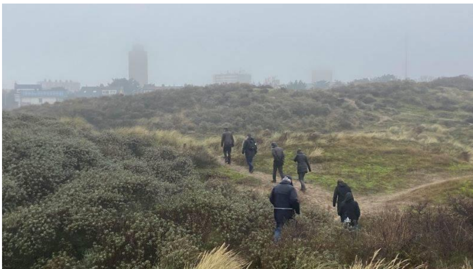
In de regen door de zuidduinen van Zandvoort

De wandelaars die meeliepen op zondagochtend 12 december werden nat. Om niet te zeggen 'zeiknat'. Het komt niet vaak voor dat we aan het einde van de wandeling helemaal doorweekt waren. Het was meer een herfstwandeling dan een winterwandeling, maar de warme chocolademelk na afloop smaakte er niet minder om. Enkele deelnemers waren uit Wageningen en Almere speciaal voor de duinwandeling naar Zandvoort gekomen.