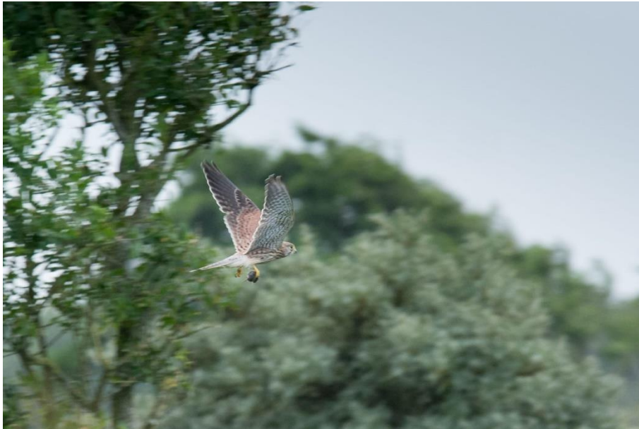
Torenvalk met prooi

Bij Starrenbroek zagen we een biddende Torenvalk. Hij dook en vloog daarna weg, op het eerste gezicht zonder prooi. Dankzij fotograaf Sylvia Schouwerwou met haar telelens konden we vaststellen dat hij toch een muisje in zijn poot hield.