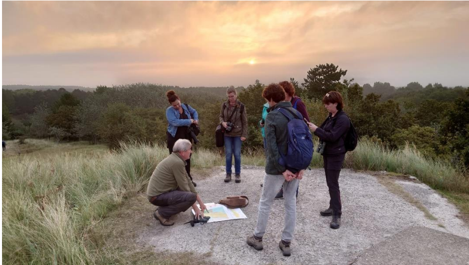
Uitleg over het ontstaan van de duinen, boven op De Tonneblink

Op een bijna windstille ochtend werd er in september in drie kleine groepen gewandeld door het duin. Het voelde vandaag als nazomer, maar de herfst kondigt zich al aan. Vruchten en zaden, bladverkleuring en zelfs de bronst kwam ter sprake.