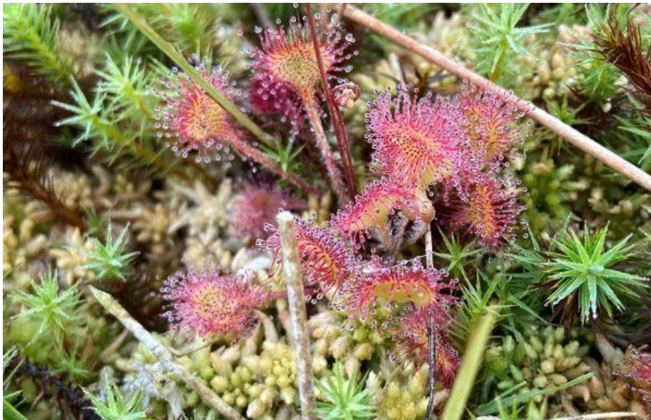
Zonnedaauw op het Groot Zwarteveld

In juli gingen we om half 6 op pad met de 8 gelukkigen die een plekje hadden bemachtigd voor de excursie. Enorm leuk om na zo veel maanden weer met natuurliefhebbers op pad te mogen. Er waren twee jonge jongens bij en dat is mooi, want jong geleerd is oud gedaan. Op de Berg van Mikwel hebben ze geleerd wat zebrarupsen zijn, en dat die alleen maar Duinkuiskruid lusten. Boven de berg bloeide ook Bezemkruid, maar op die plant vonden we geen enkele rups. Het uitzicht vanaf Mikwel was betoverend. Een oranjerode zon kwam net boven de bomen in de verte. Alles was stil, behalve de Groene specht die even zijn lachende roep liet horen.